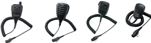
HM-171GPW HM-168LWP HM-159LA HM-158LA

HM-158LA: Kompaktes Lautsprecher-Mikrofon mit 3,5-mm-Stecker