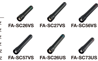
FA-SC26VS FA-SC27VS FA-SC56VS FA-SC57VS FA-SC26US FA-SC73US