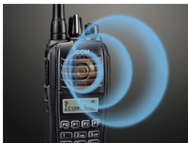
1500 mW NF-Leistung