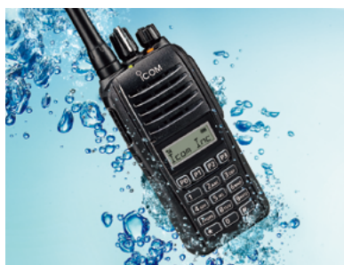
Wasserdicht für 30 Minuten in 1 m Tiefe