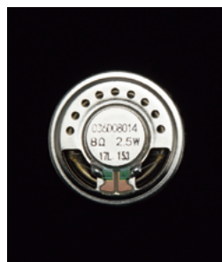
Icoms spezieller Hochleistungs-Lautsprecher