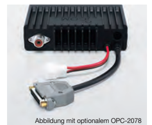
Abbildung mit optionalem OPC-2078

Zur Steuerung des NF-Ausgangs, des Modulationseingangs, zur Fernbedienung, zum Steuern eines Signalhorns und für viele weitere Funktionen stehen optionale Zubehörcable zur Verfügung. Das OPC-1939 ist die Sub-D-15-Pin-Ausführung und das OPC-2078 die 25-polige Variante des Kabels.