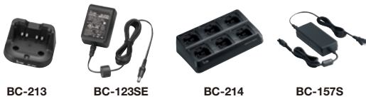
BC-213 BC-123SE BC-214 BC-157S

BC-214: Mehrfachlader Zum gleichzeitigen Laden von bis zu sechs Handfunkgeräten oder Akkupacks. + BC-157S: Netzadapter * Der Ladeadapter AD-130 wird mit dem BC-214 geliefert, je nach Version.