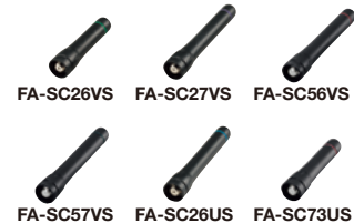
FA-SC26VS FA-SC27VS FA-SC56VS FA-SC57VS FA-SC26US FA-SC73US

FA-SC26VS: 136–144 MHz FA-SC27VS: 142–150 MHz FA-SC56VS: 150–162 MHz FA-SC57VS: 160–174 MHz FA-SC26US: 400–450 MHz FA-SC73US: 450–490 MHz